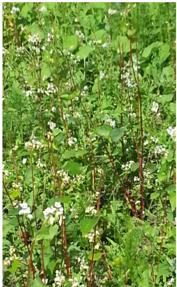
Buchweizenfeld nach Unkrautbearbeitung