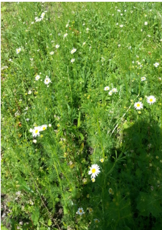
Buchweizenfeld vor Unkrautbearbeitung

Da hilft alles nichts, jetzt heißt es Buckeln und mit Muskelkraft die Unkräuter dezimieren.