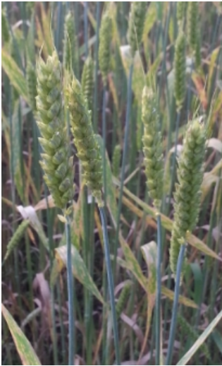
Mauerner unbegrannter Brauner