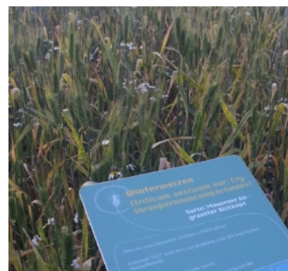
Mauerner begrante Dickkopf

Um den bestmöglichen Ertrag und geringe Krankheitsanfälligkeit auf hiesigen Standorten zu erreichen, wurden Sorten gekreuzt und die besten Pflanzen selektiert. Für den Laien sind die Unterschiede aber nur schwer erkennbar – oder würden Sie diese ohne unsere Schilder unterscheiden können?